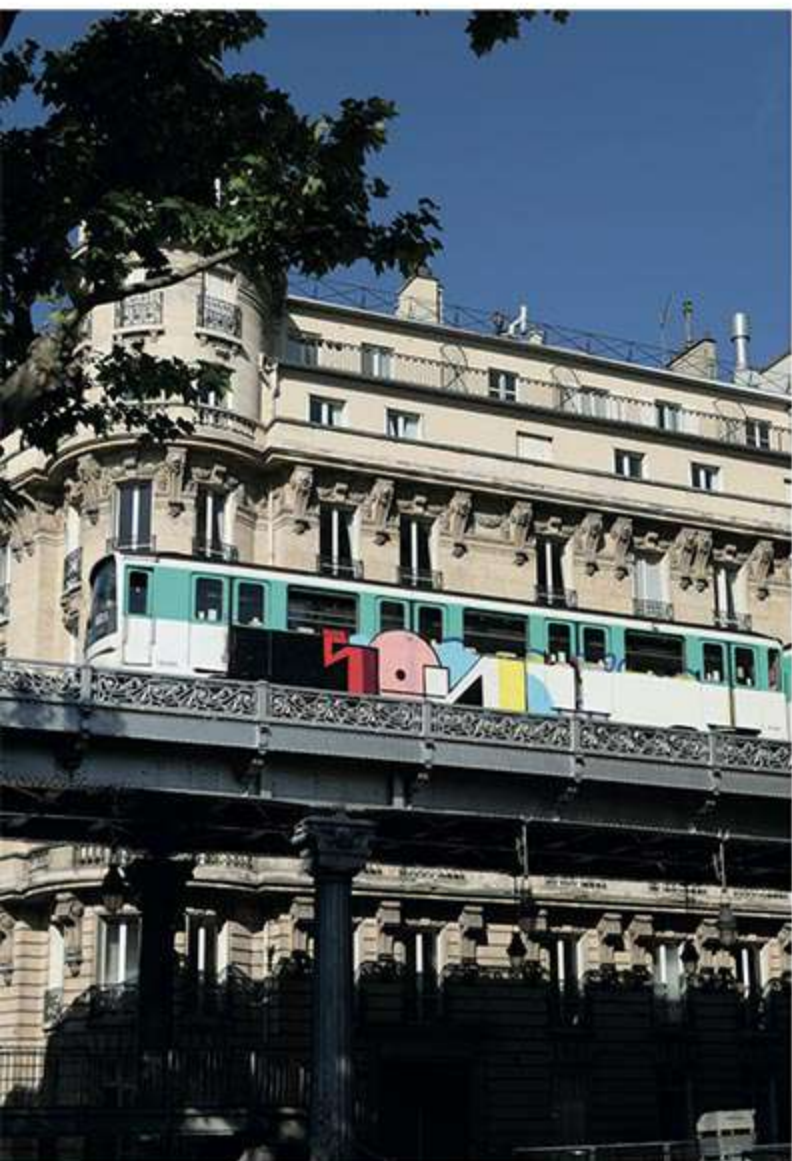
AGUZZON - Mai 2020

M: Je savais avant de venir que la ligne 6 était vraiment cartonnée, j'avais vu des photos sur le net, mais voir toutes ces pièces circuler, c'était vraiment impressionnant. Je pense que j'ai raté la période pendant laquelle Paris était vraiment cartonné, mais tu ressens l'effervescence des locaux et ça motive en tant que «touriste». C'est peut-être lié à cette période bizarre liée à la pandémie, mais voir que nos pièces ont circulé pendant des mois, c'était vraiment mortel.