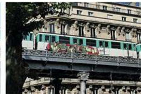
WIFIS - Mai 2020