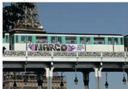
NARCO - Septembre 2020