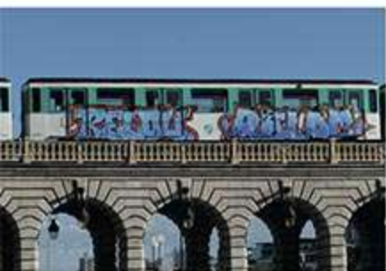
RELOU RELOU - Septembre 2020