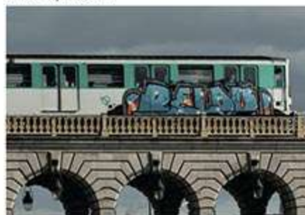
RELOU - Septembre 2020