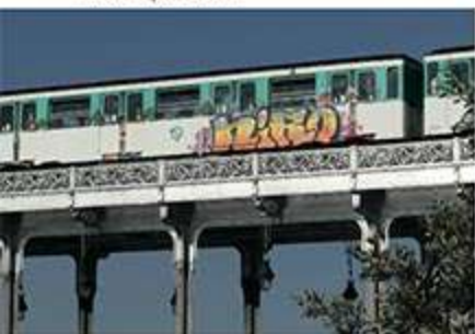
NIRO - Septembre 2020