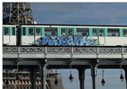
RARZAR - Décembre 2020