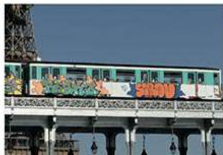
REKZ SIROU - Septembre 2020