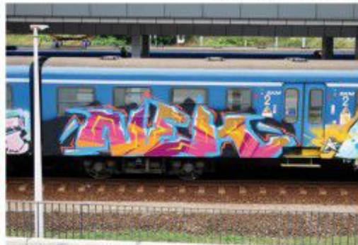
Mik SYF HDR 2020 Góralik SKM train