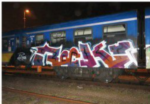
Rocky SYF HDR 2020 Góralik SKM train