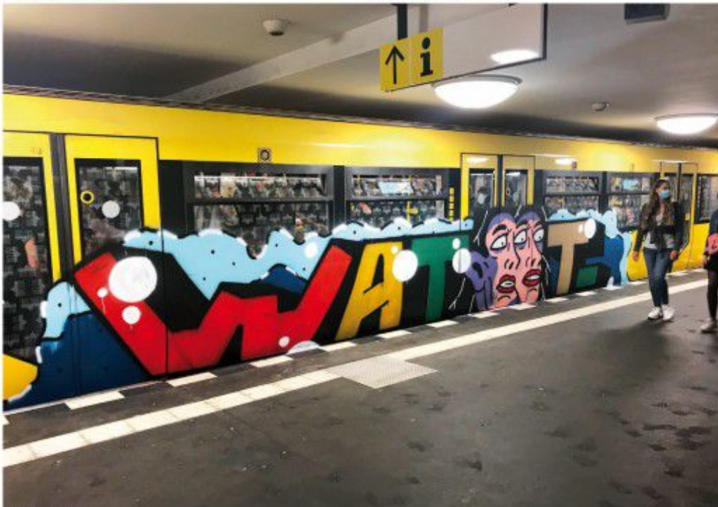
WAT 2020 Berlin metro