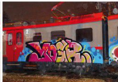
Yagi 2020 Łódzkie regional train