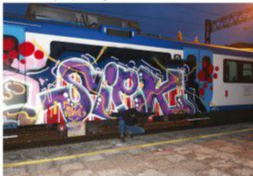
Siek DSK HRD 2020 Warmińsko-mazurskie regional train