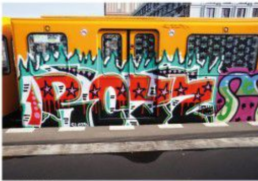
Maia SCD 2020 Berlin metro