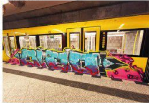
Cleo RATS NYC WK 2020 Berlin metro