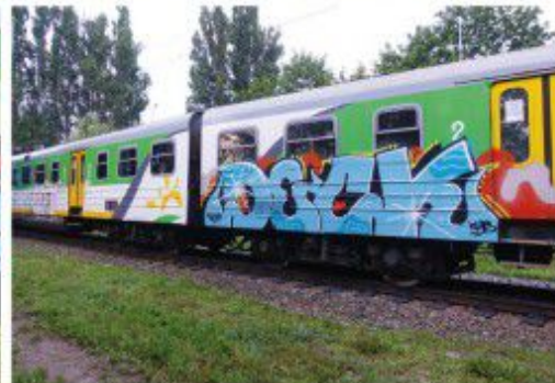
Deck KMB 2020 Warsaw regional train