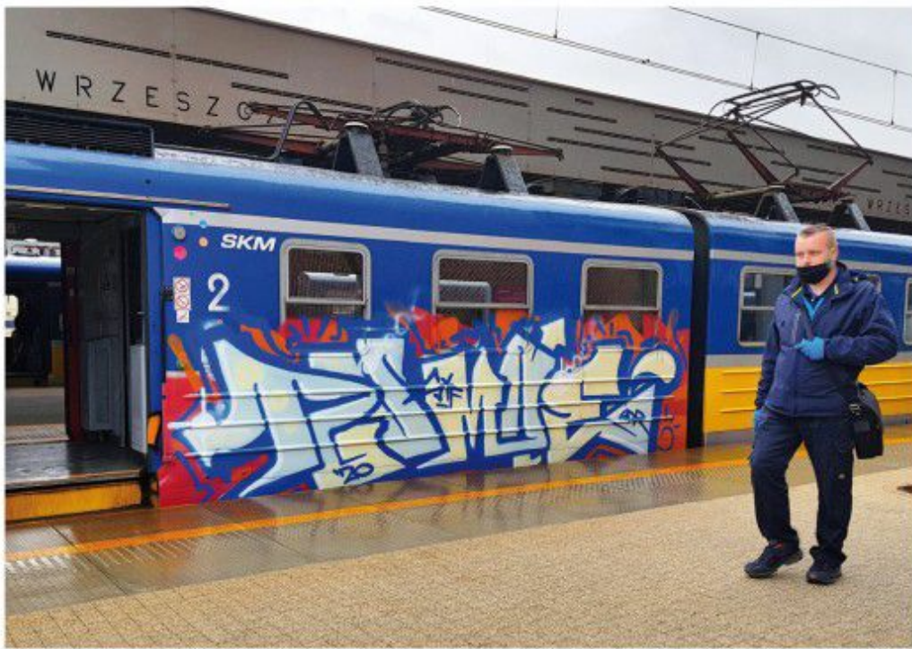
Roman SYF ADR 2020 Góralik SKM train