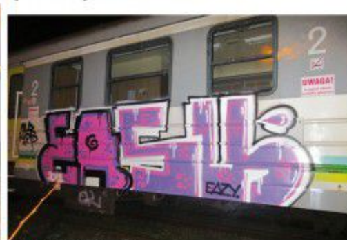
Eszyk OK 2020 Lubuskie regional train