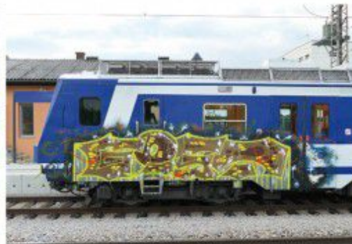
Flak B2M 2020 Vienna-train