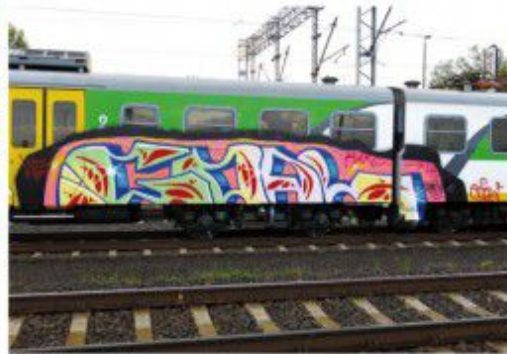
Goal DRS WTK ALKO 2020 Warsaw regional train