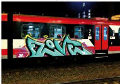
Flewa BDK 2020 Kujawsko-pomorskie regional train