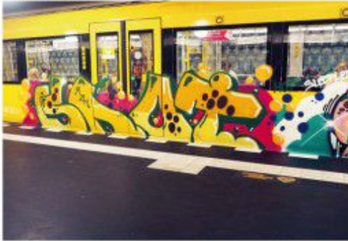
Shor HOT KTR KSA 2020 Berlin metro