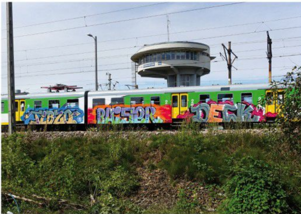
Tibco SBE Baiser UKS SHC Deck KMB 2020 Warsaw regional train