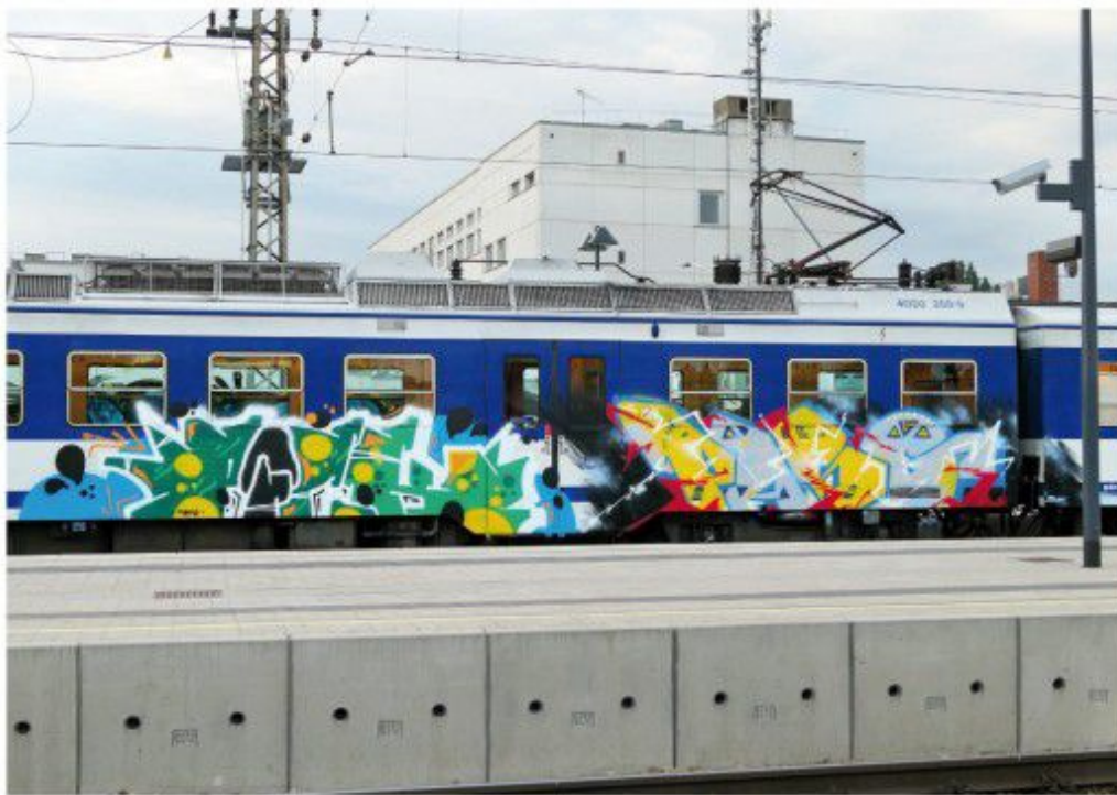
Pick Pass HPR BY 2020 Vienna-train