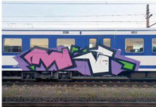
Maker TSU 2020 Vienna-train