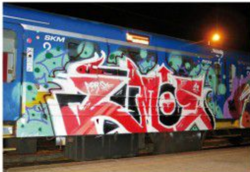
Roman SYF ADR 2020 Góralik SKM train