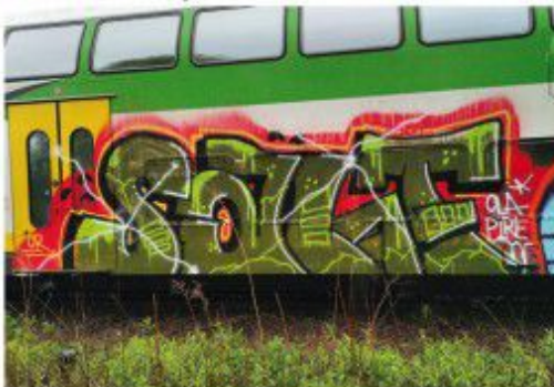
Salt CR 2018 Warsaw regional train