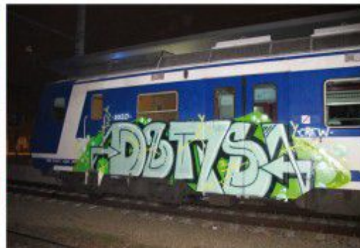
DBTS 2019 Vienna-train