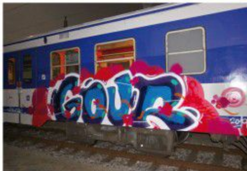
GDUR 2019 Vienna-train