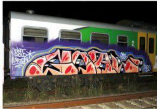
Goal DRS WTK ALKO 2020 Warsaw regional train