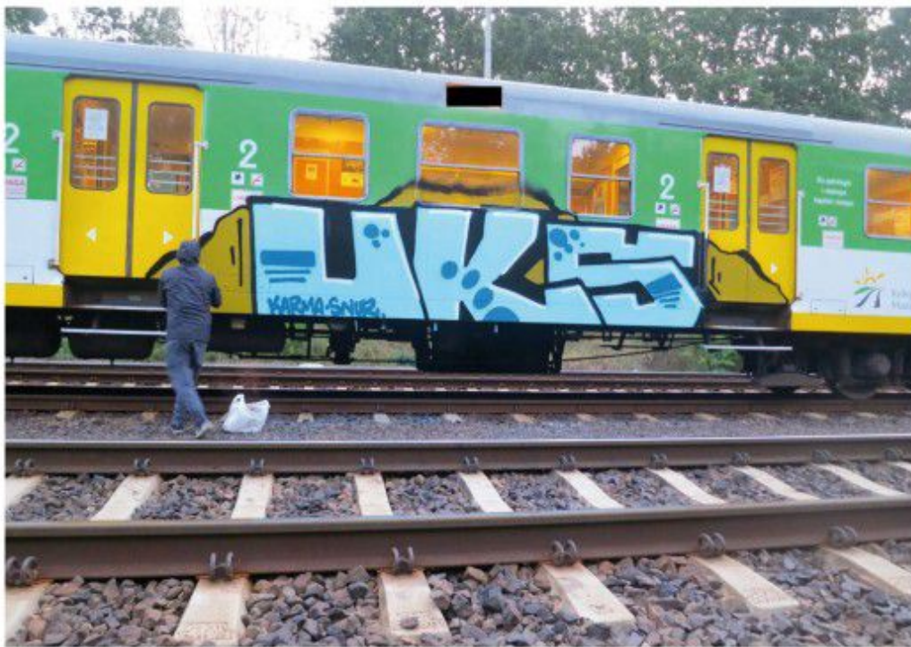
UE5 2020 Warsaw regional train

Karma: For me it's a piece that is well executed technically and has some pre-meditated flow. What is more, the idea is a very important factor. I tend to think more and more often that it's the patents and the idea which sell the piece.