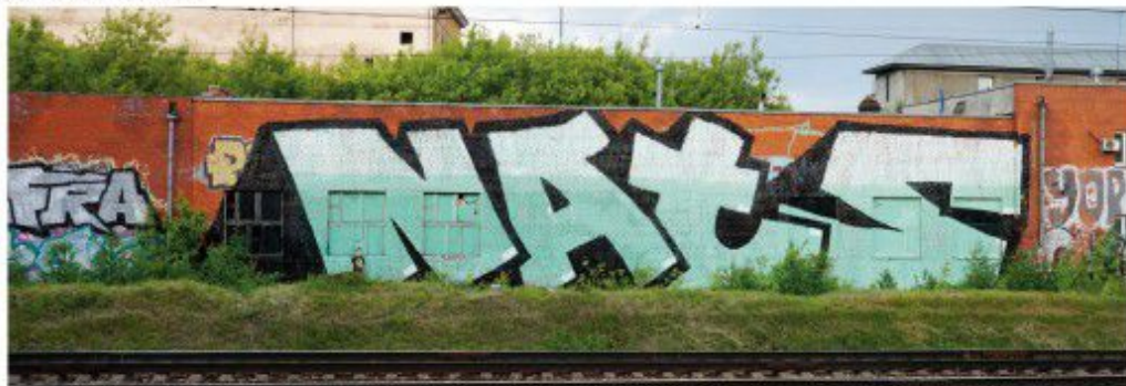
NATS 2010 Moscow