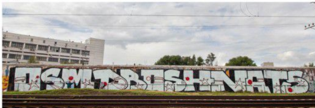
OSH D.BOSH NATS 2010 Moscow