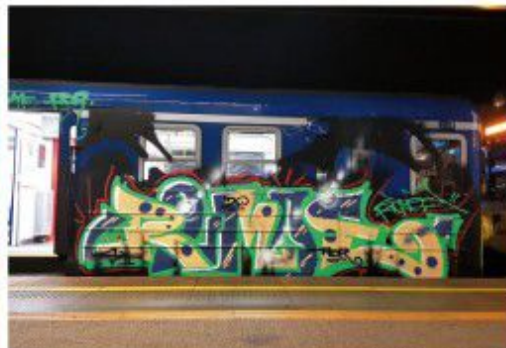
Roman SYF ADR 2020 Góralik SKM train