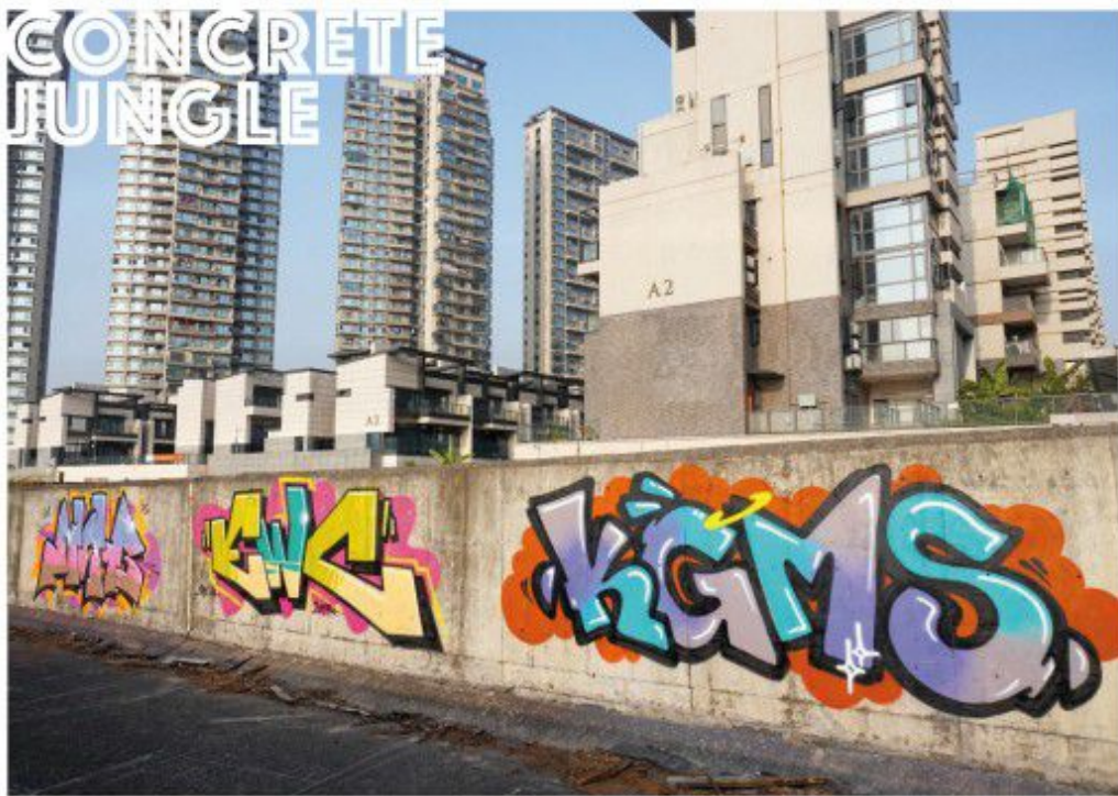
KSB EWC KIMS 2010 Shenzhen