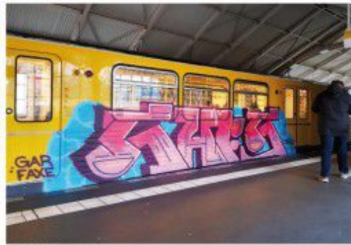
CHEPS 2020 Berlin metro