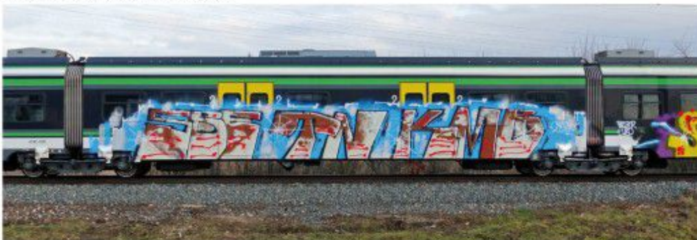
SBE TA KMB 2020 Warsaw regional train