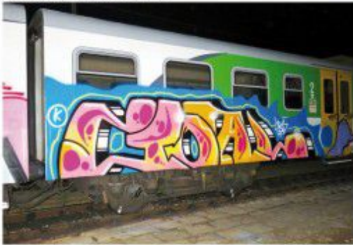
Goal DRS WTK ALKO 2020 Warsaw regional train