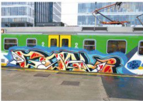
Goal DRS WTK ALKO 2020 Warsaw regional train