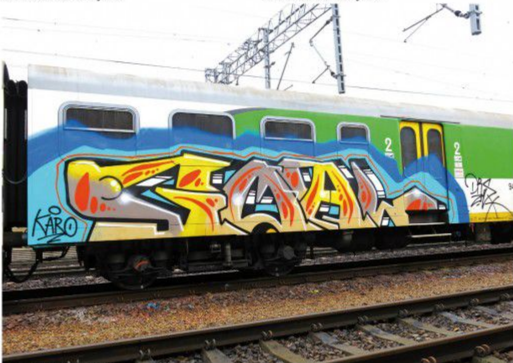
Goal DRS WTK ALKO 2020 Warsaw regional train