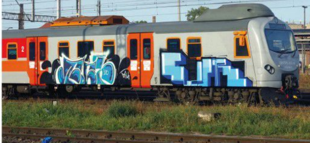
Foch Elar TCH K3D 2020 Poland "Feska" regional train