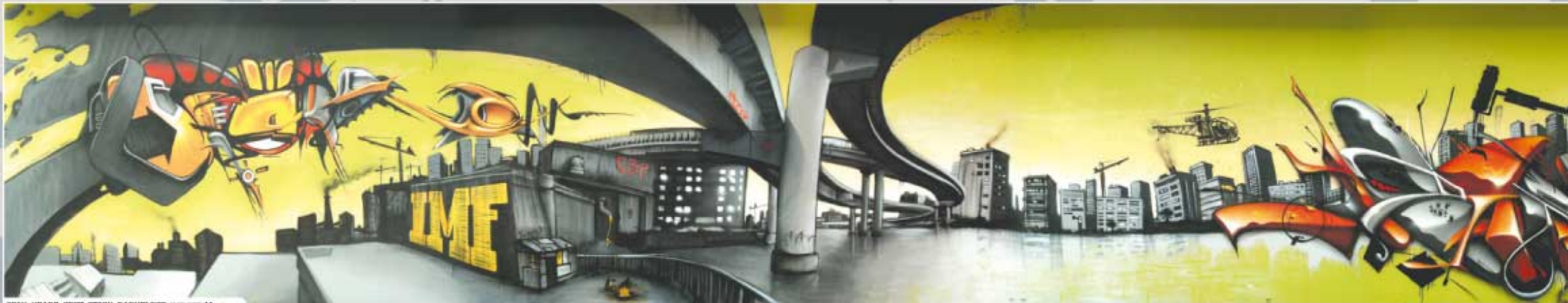
GPAK, YEARZ, SPOT, STACK, DARKELDER IMF CCC Manteo