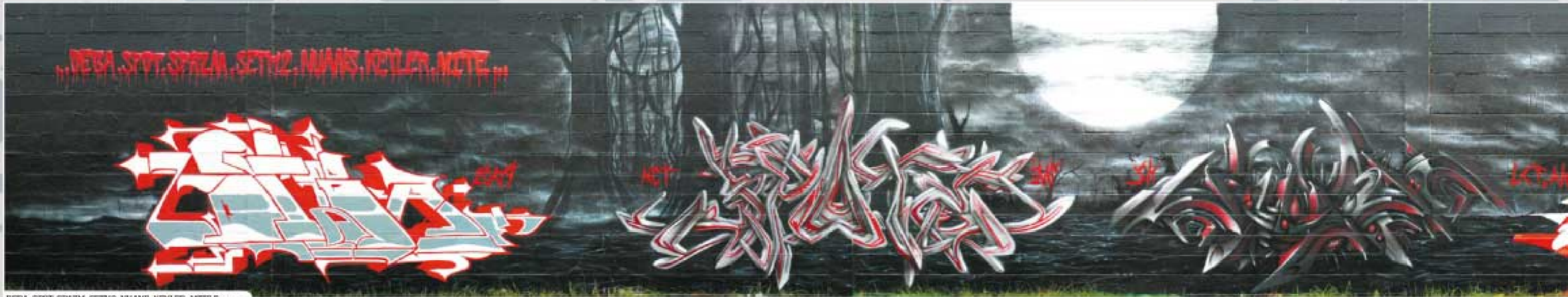
DEBA, SPOT, SPZM, SETH2, NIANS, HEYLER, MITE France