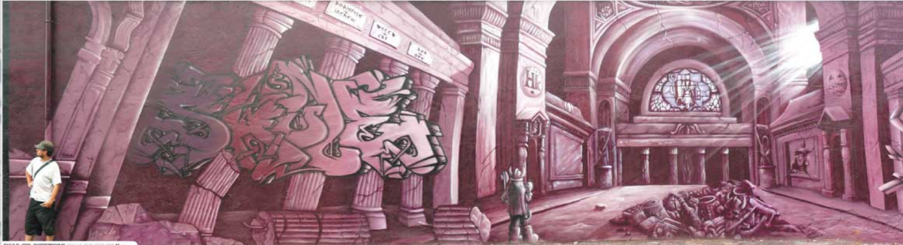
SHULE, CEO, INSERTCOINS DIV IA DND CNF CCC Nancy