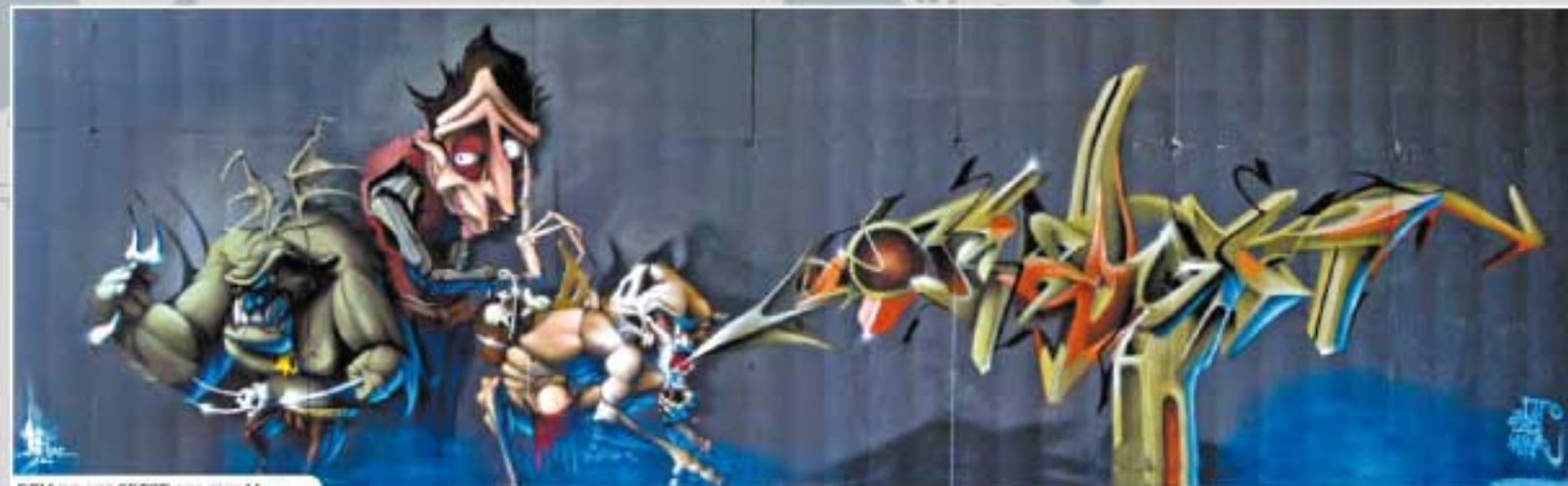
REM DC AGO OREST 101 PUN Macey