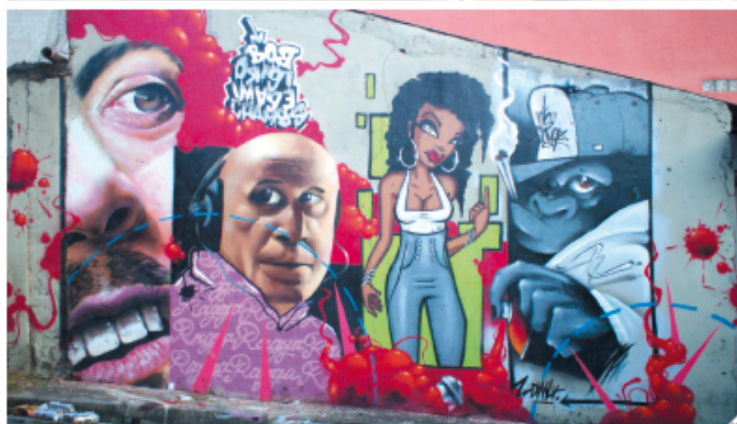
1: BONZA (Anglaterra) 2: GOUGE (Saldia) 3: ANC (Italia) 4: MIEDO (Espanya) 5: ZEUS40 (Italia) 6: MORNA (Croàtia) 7: SKILL (Bèlgica) 8: MR ZERO 9: CREA (Italia) 10: BOBI 11: CAKTUS (Italia) 12: BOB, ORIGI IMAGE, CHAMBS (Bòsnia)