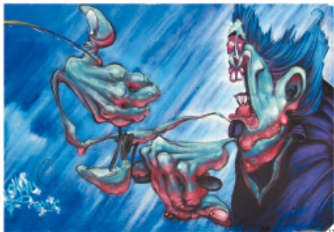
1: ASPHE 2: YMEN (France) 3: GRAPHIS (Brésil) 4: DEP (Argentine) 5: PSA Crew 6: SHOCK (Brésil) 7: HANS (France) 8: VITRIOL VECTORZ (France) 9: LOGAN (Espagne) 10: FAST (France) 11: DEAN (Espagne) 12: GEB (France) 13: CHAFU (Espagne)