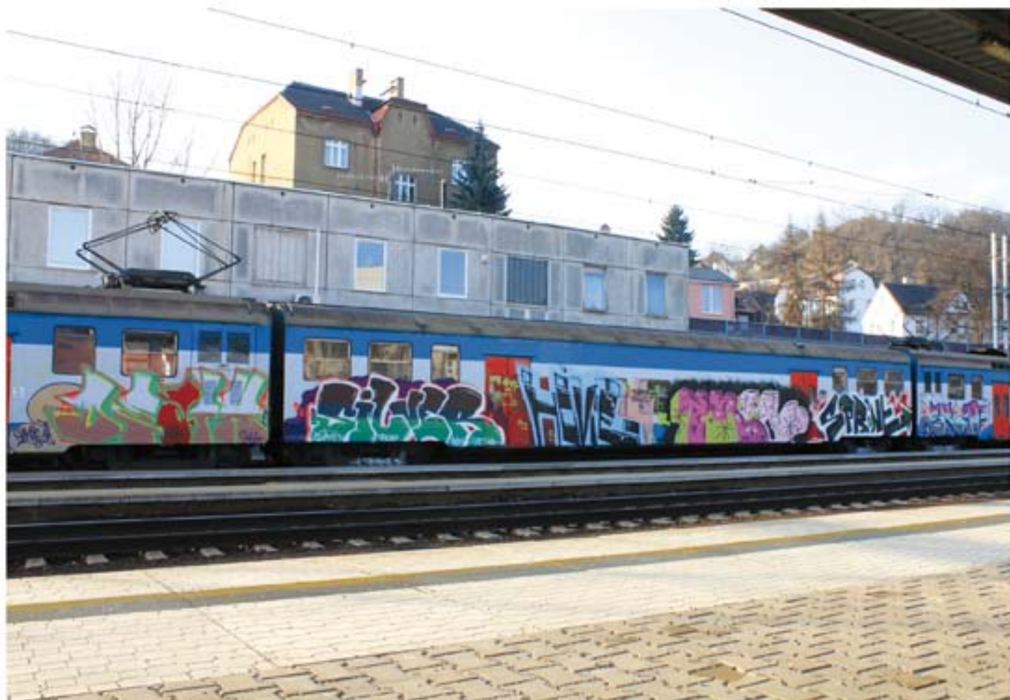
Death.T2B Silver.T2B Hovie.ANS.CB Tree.RHC.CB.AL Sprint.RDS.CB Skid.ANS '11 Praha regional train