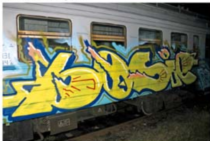
Bosie.FAT315 '11 Kiev regional train