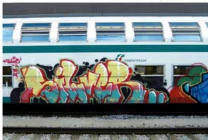
Silver.T2B '11 Italy regional train