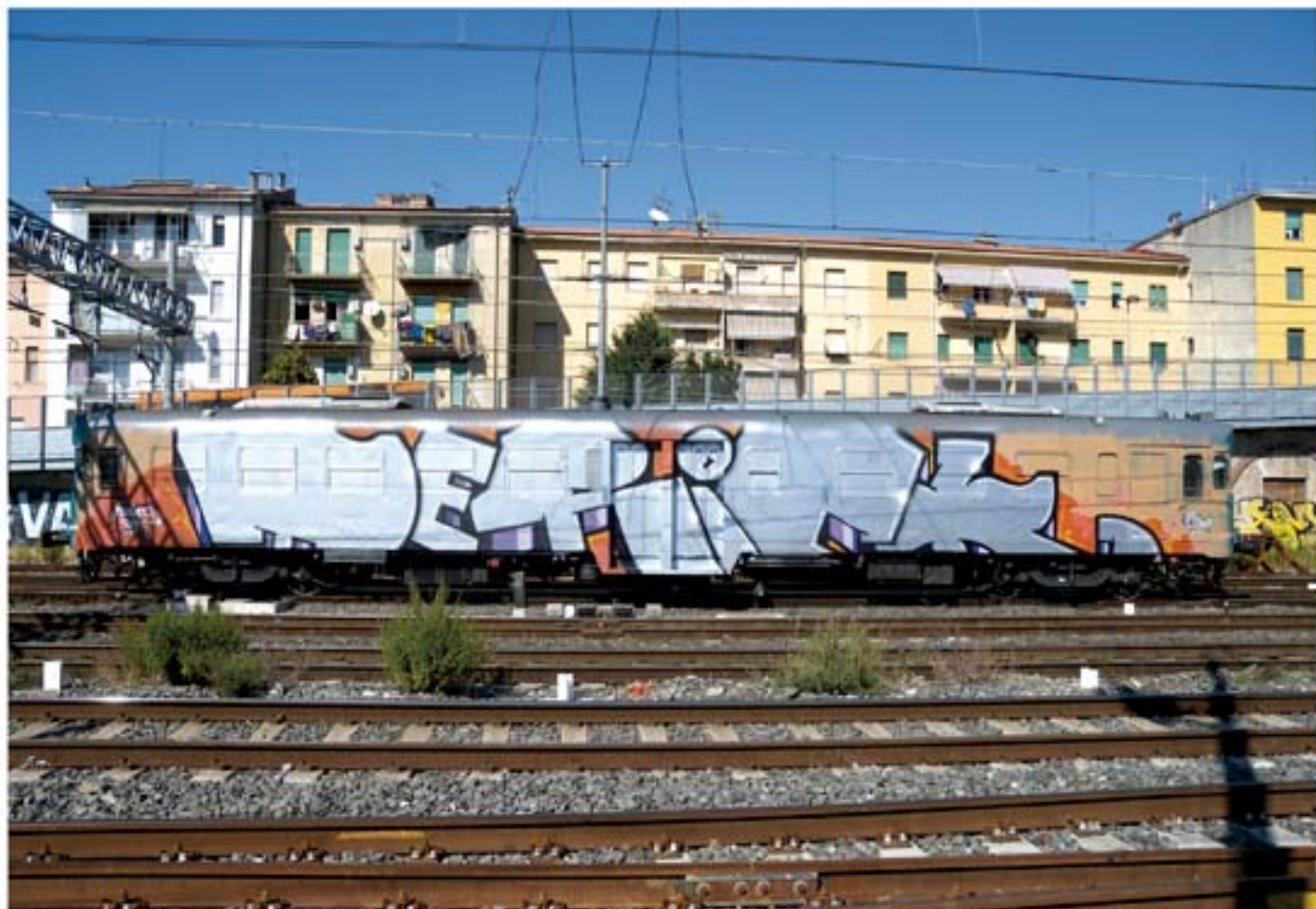
Derick.MUTANTS.SPK '11 Italy regional train