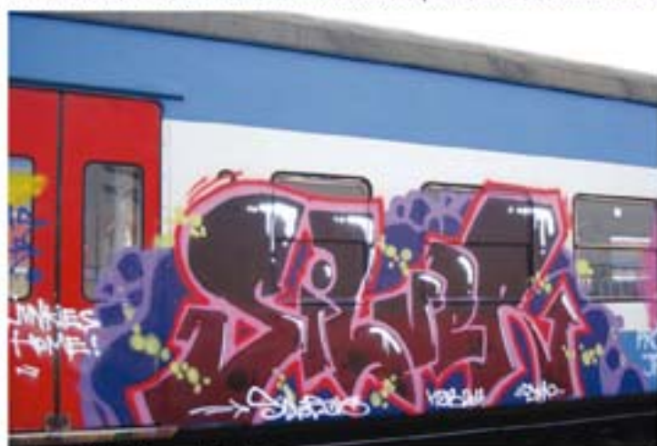
Silver.T2B '11 Praha regional train