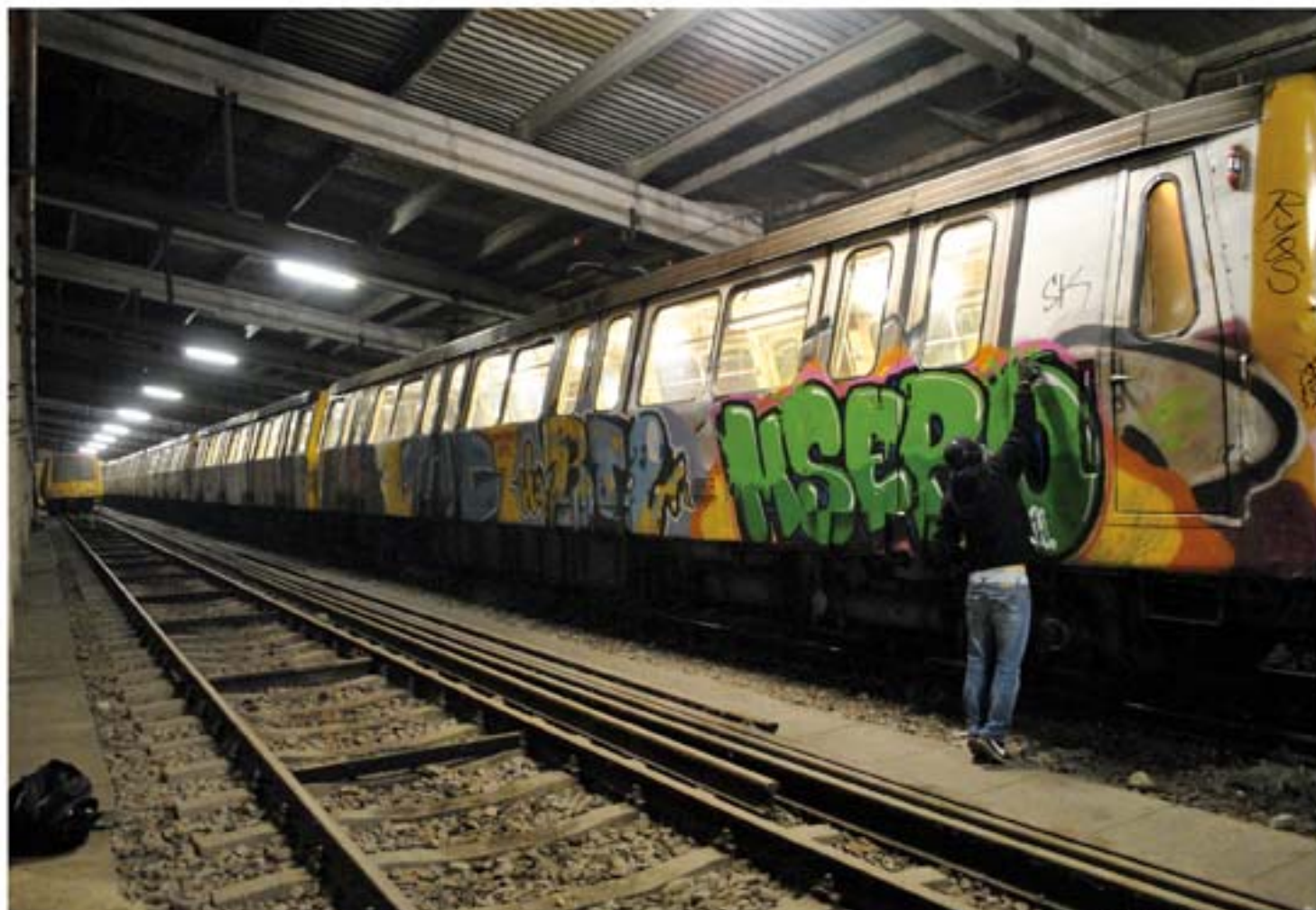
Msero.MW Bucharest metro