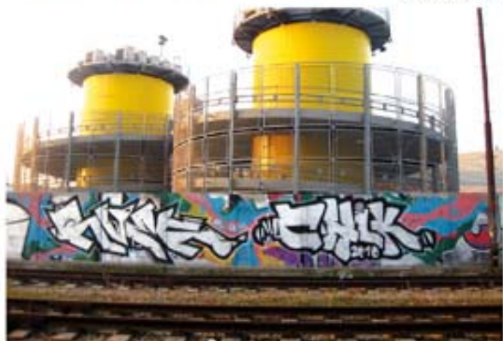
Rwek.ACL.ODA Chiko.RES.ACL'11 Brno