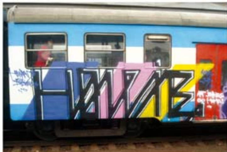
Hovie.ANS.CB '11 Praha regional train