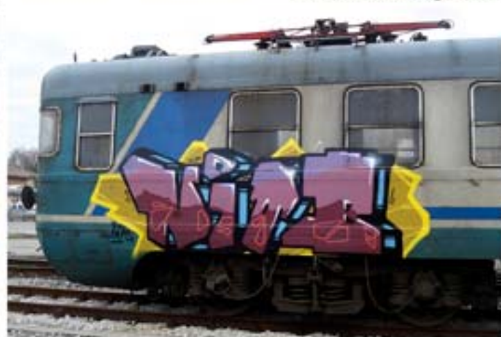
Niob.ISK '11 Italy regional train