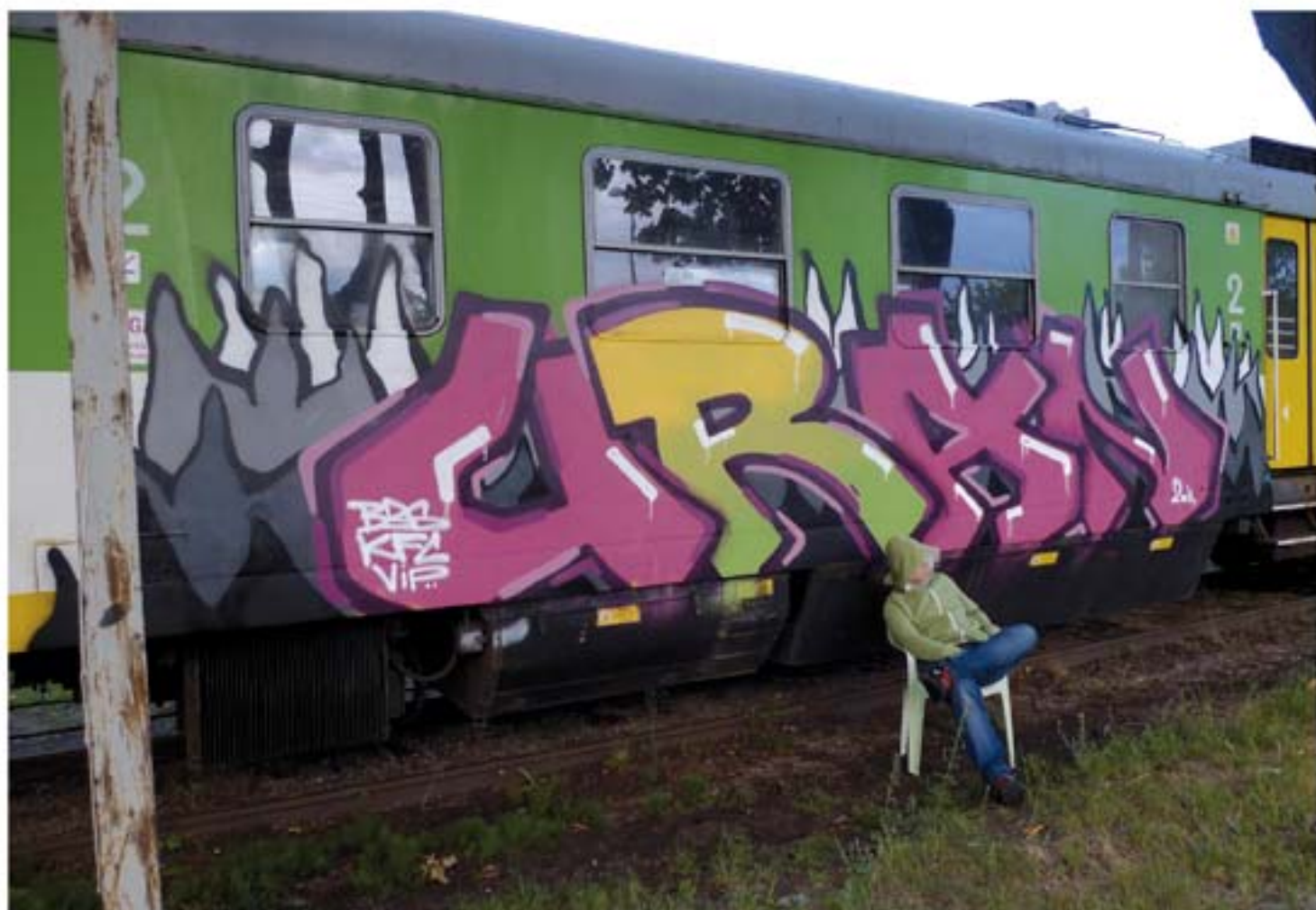
Uran.B35.KFC.VIP'11 Warsaw regional train