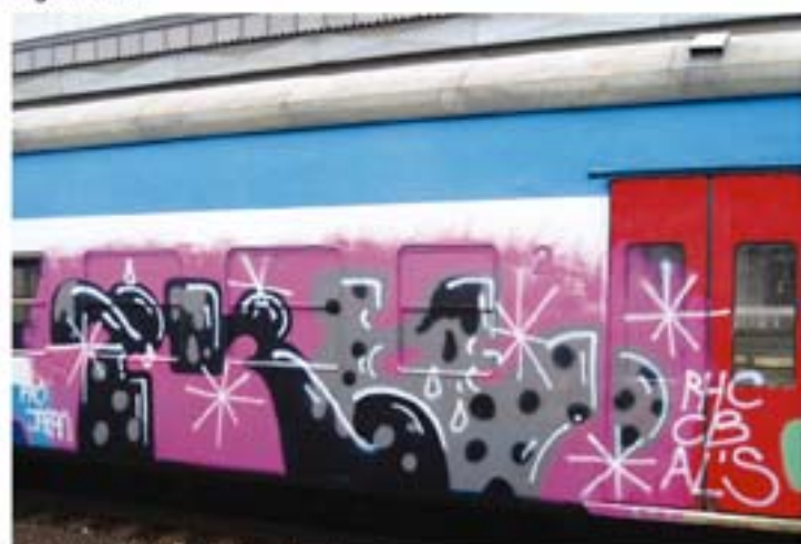
Tree.RHC.CB.AL '11 Praha regional train