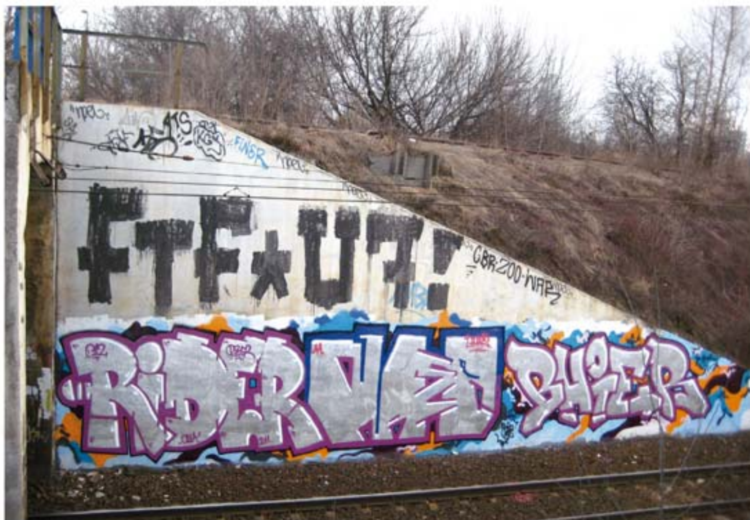
Rider.012 Nasc.UHA Bhier.012.RMS.UHA'11 Warsaw