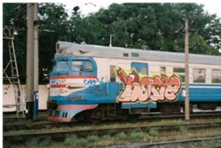
Bosie.FAT315 '11 Evpatoriya regional train