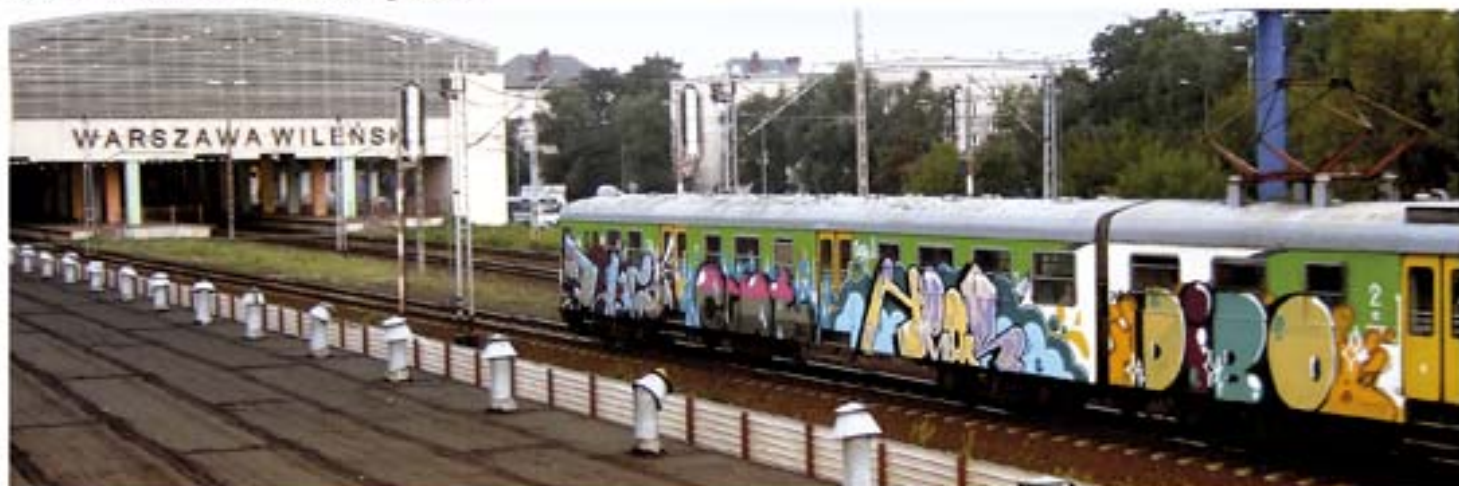
70C Cent.KFC Heor.SW Dibo.HOT'10 Warsaw regional train