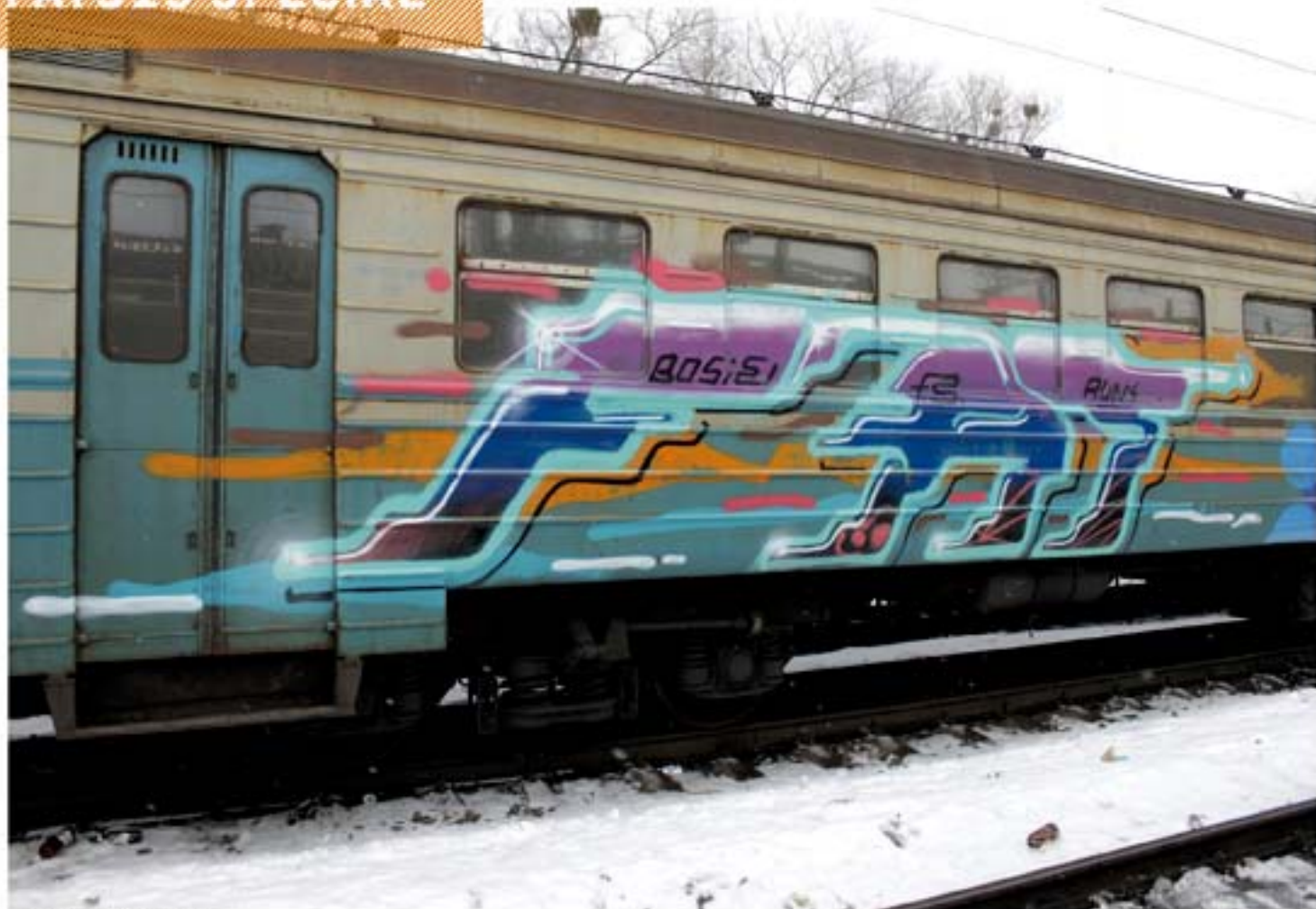
FAT '10 Kiev regional train