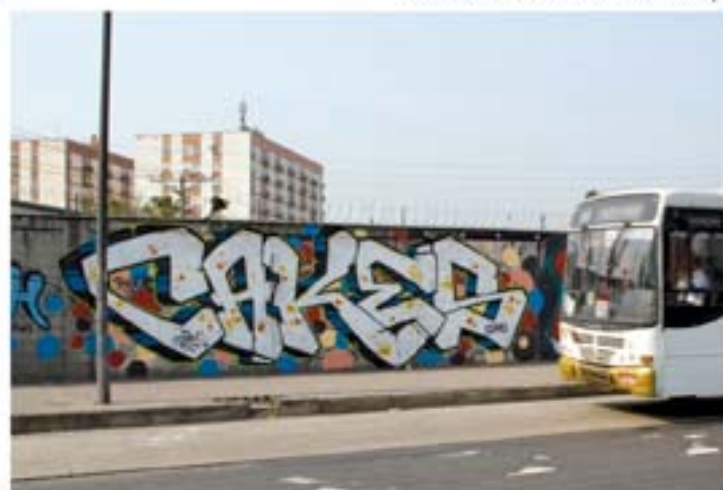
Cakes.DSK'10 Rio de Janeiro