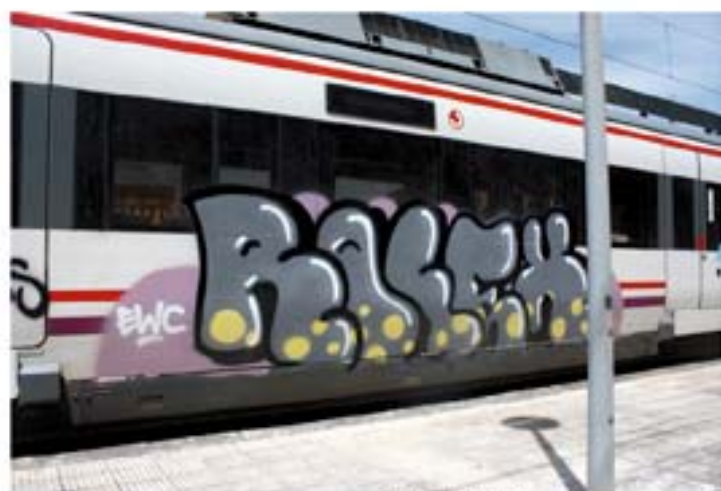
Rolex.EWC '11 Barcelona regional train