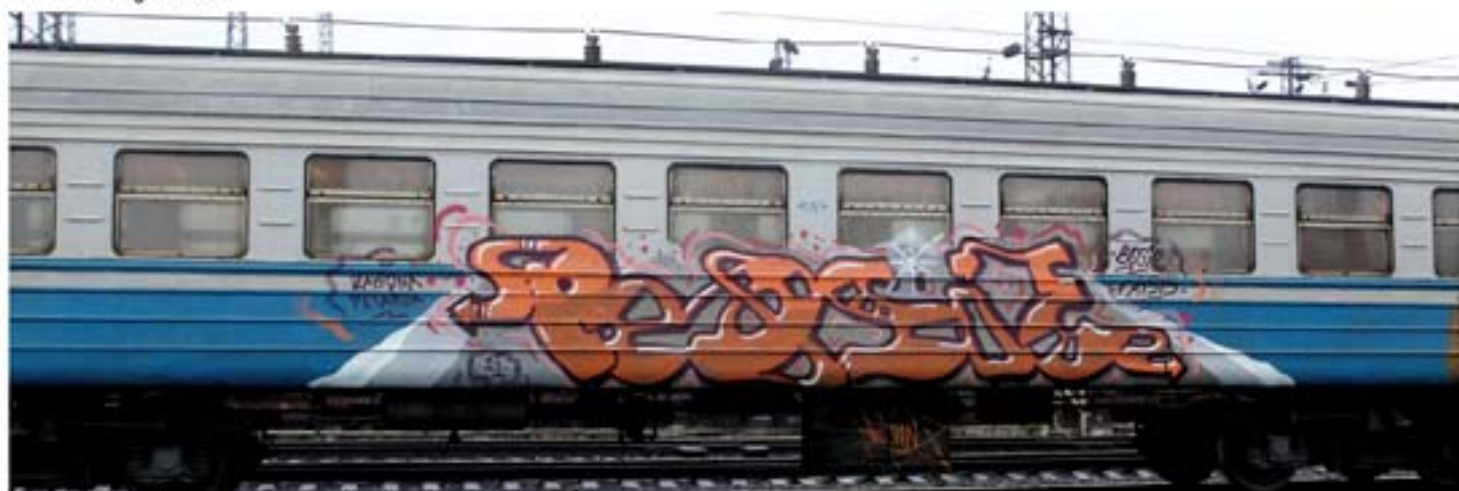
Bosie.FAT315 '10 Lviv regional train