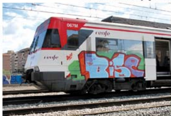
Bisc.TRU '11 Madrid regional train