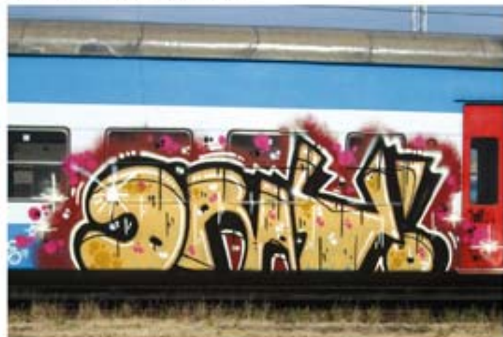
Dray '11 Praha regional train