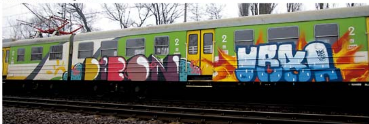
Dibon.HOT Uran.B35.KFC.VIP'11 Warsaw regional train