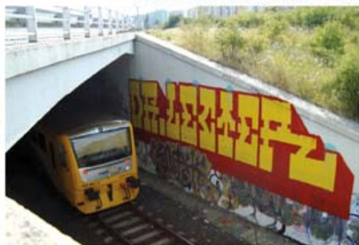
Dr.Lecter.TFM.WAP.TWO '11 Czech Rep.